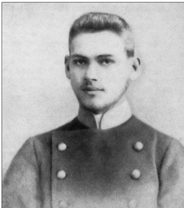
Л.С.Берг в студенческие годы.

Отсюда практические советы. Не селитесь в низинных местах: рано или поздно ваш дом затопит. Не селитесь на крутых склонах и под ними: рано или поздно произойдет обвал, в лучшем случае потоки воды размоют фундамент дома. Срубите дерево, падение которого может задеть ваше жили-