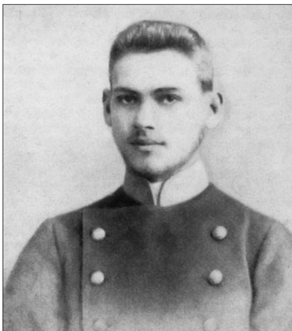
Л.С.Берг в студенческие годы.

Отсюда практические советы. Не селитесь в низинных местах: рано или поздно ваш дом затопит. Не селитесь на крутых склонах и под ними: рано или поздно произойдет обвал, в лучшем случае потоки воды размоют фундамент дома. Срубите дерево, падение которого может задеть ваше жили-